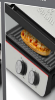
Горячие бутерброды: фиксация крышки