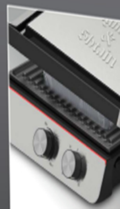
Запекание: эффект жаровни