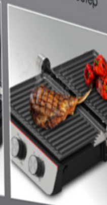
Барбекю: открытие на 180°