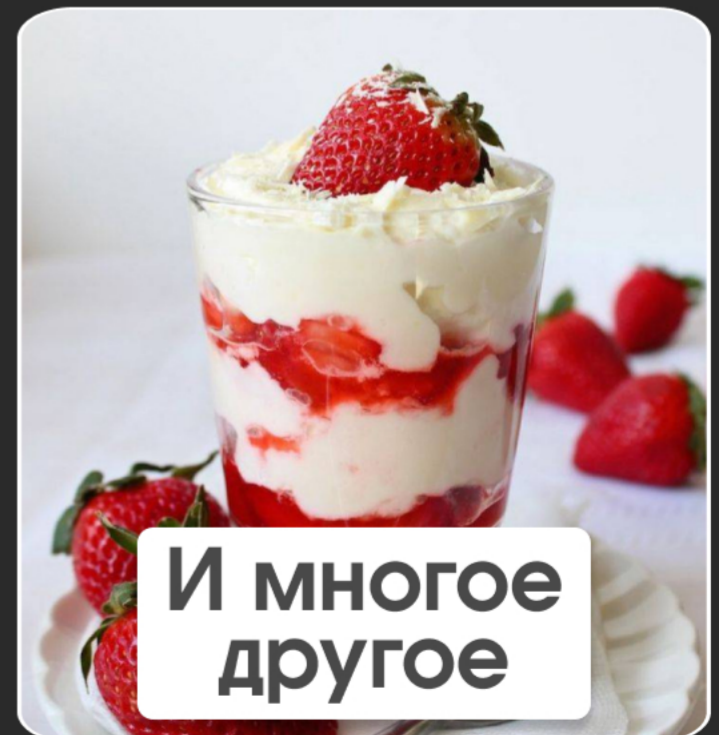
И многое другое