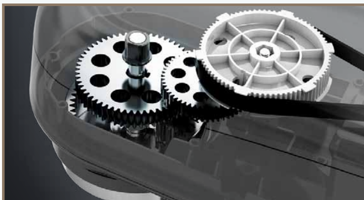
Планетарный металлический редуктор – надежный и долговечный механизм