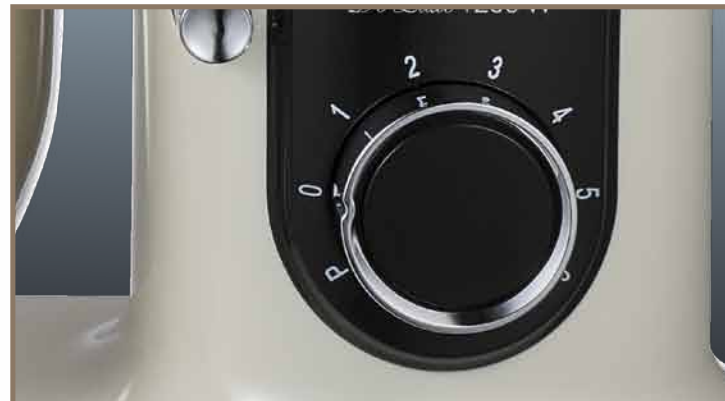
Плавное переключение скоростей