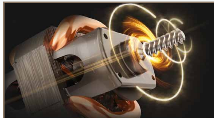
Мощный АС-двигатель с усиленной медной обмоткой