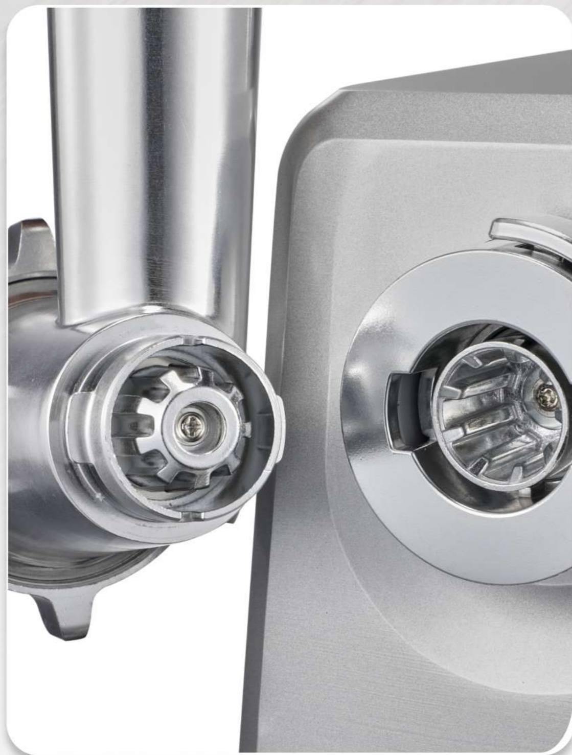
Металлическое соединение двигателя и шнека