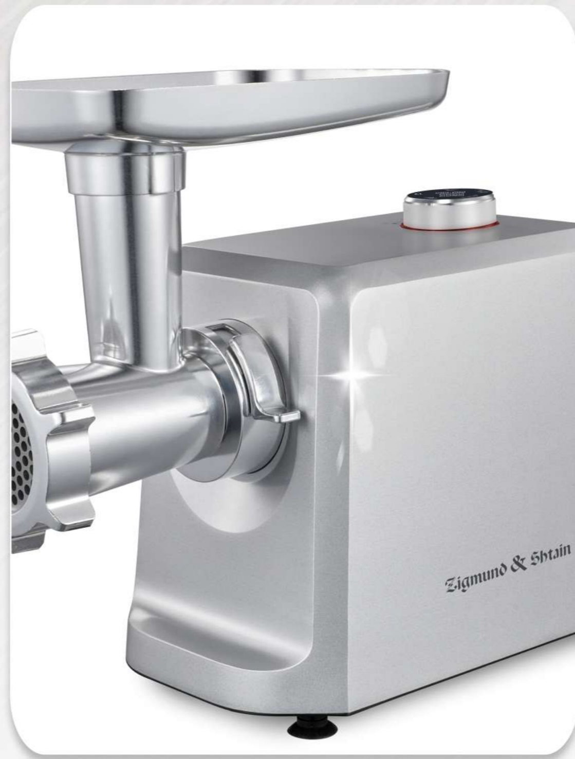
Прочный цельнометаллический корпус