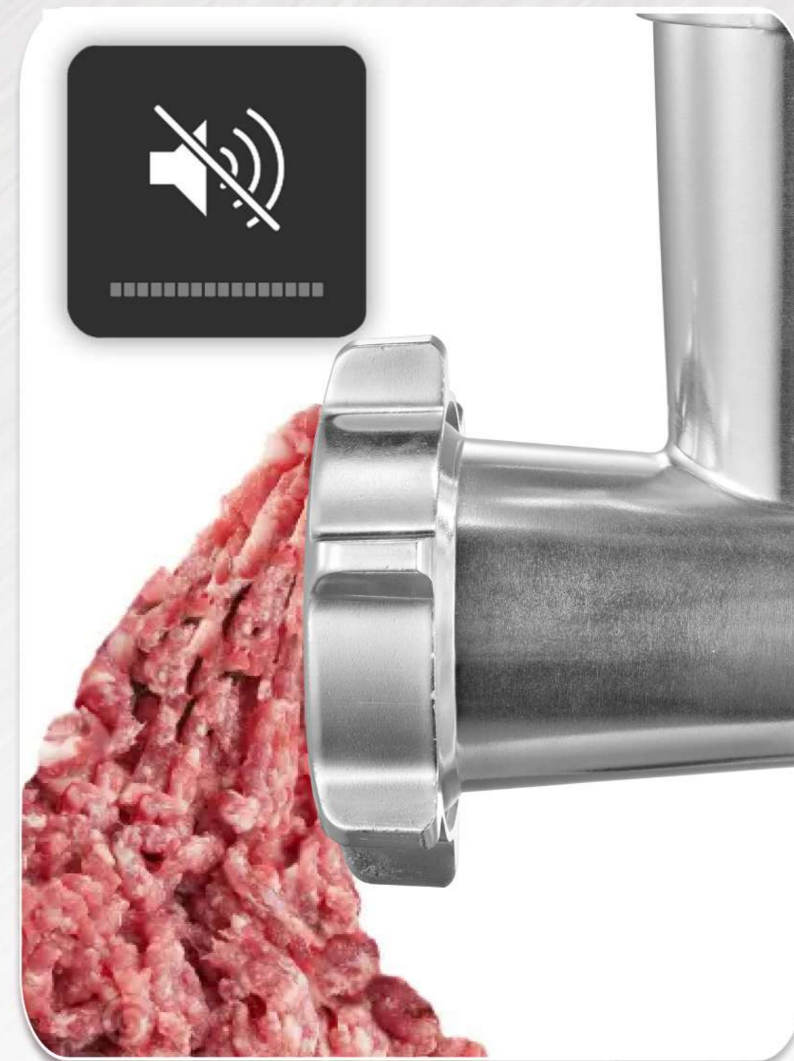
Низкий уровень шума